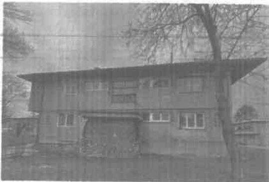
Prije implementacije mjera EE