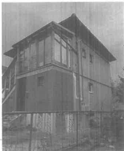
Prije implementacije mjera EE