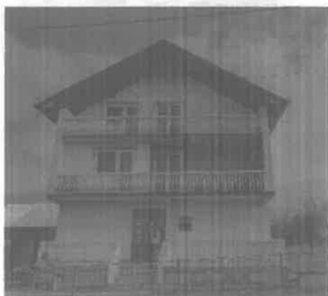
Prije implementacije mjera EE